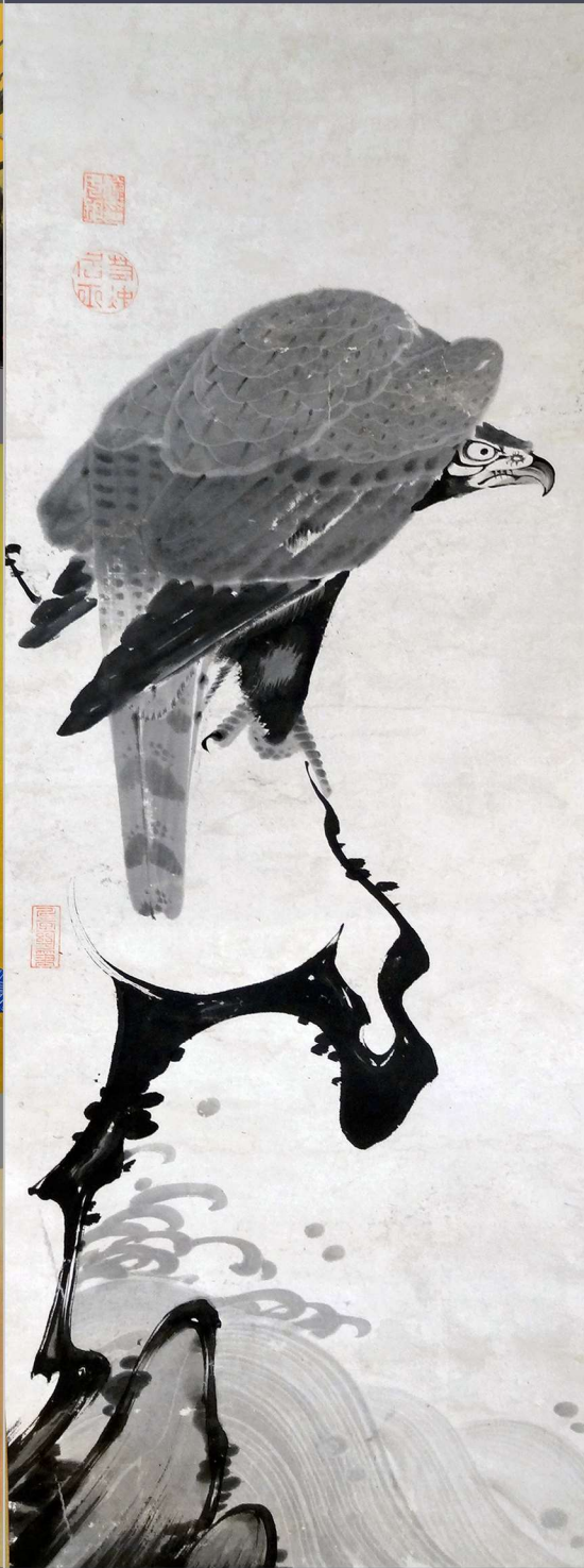
伊藤若冲「巖上鷲図」