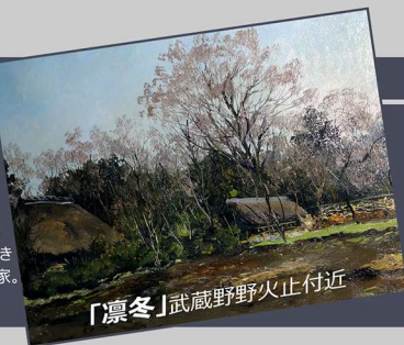
「凧冬」武蔵野野火止付近

1901-1995 40年以上に渡り北海道から鹿児島までを旅し、生涯古い民家の絵を描き続け「民家の向井」と呼ばれた洋画家。