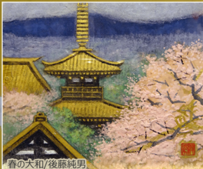
春の大和/後藤純男