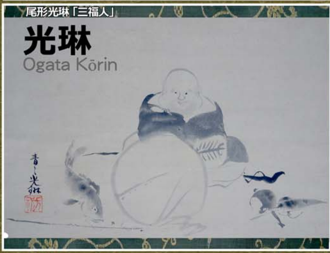
光琳 Ogata Kōrin