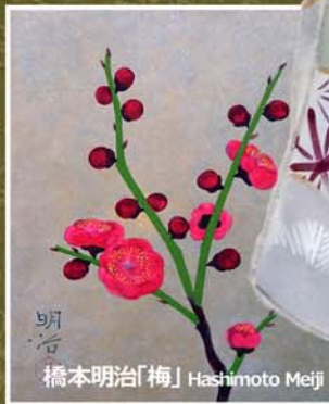
橋本明治「梅」 Hashimoto Meiji