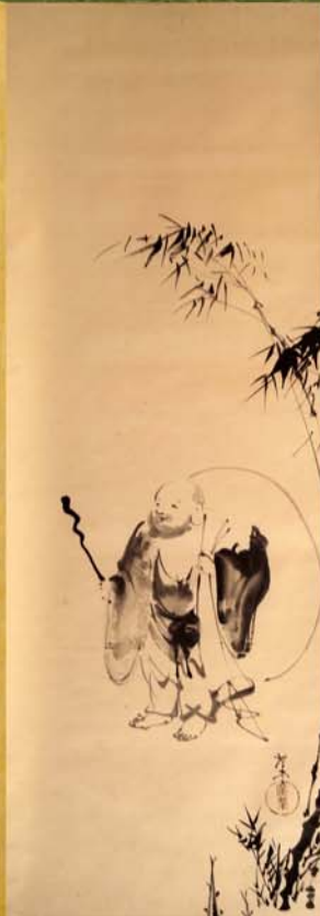
寺崎廣業(布袋) TERASAKI KOGYO