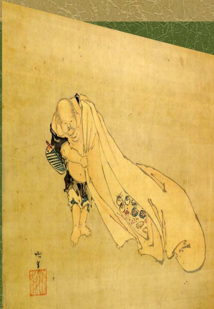
葛飾北斎 (布袋の図) KATSUSHIKA HOKUSAI